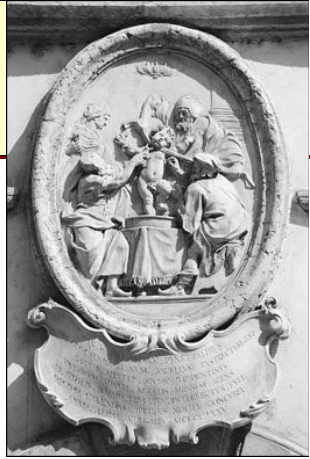
Illustration : Saint Simon de Trente, enfant assassiné en martyr au cours d'un sacrifice rituel par des juifs intégristes en 1475.

→ des enfants à naître assassinés par contraception-avortement par haine de la Vie fontale* 92 et originelle : Dieu !