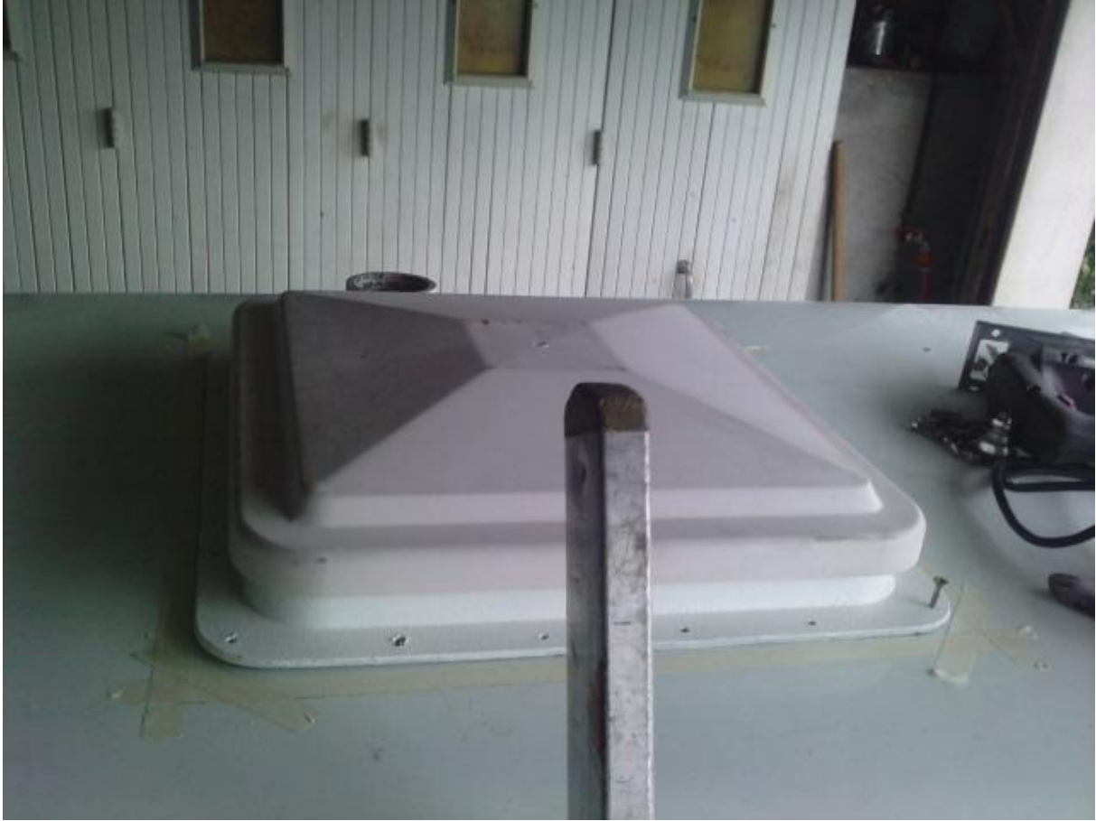
pose des vis