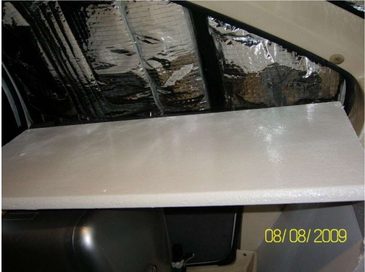
Photos du montage de la baignoire