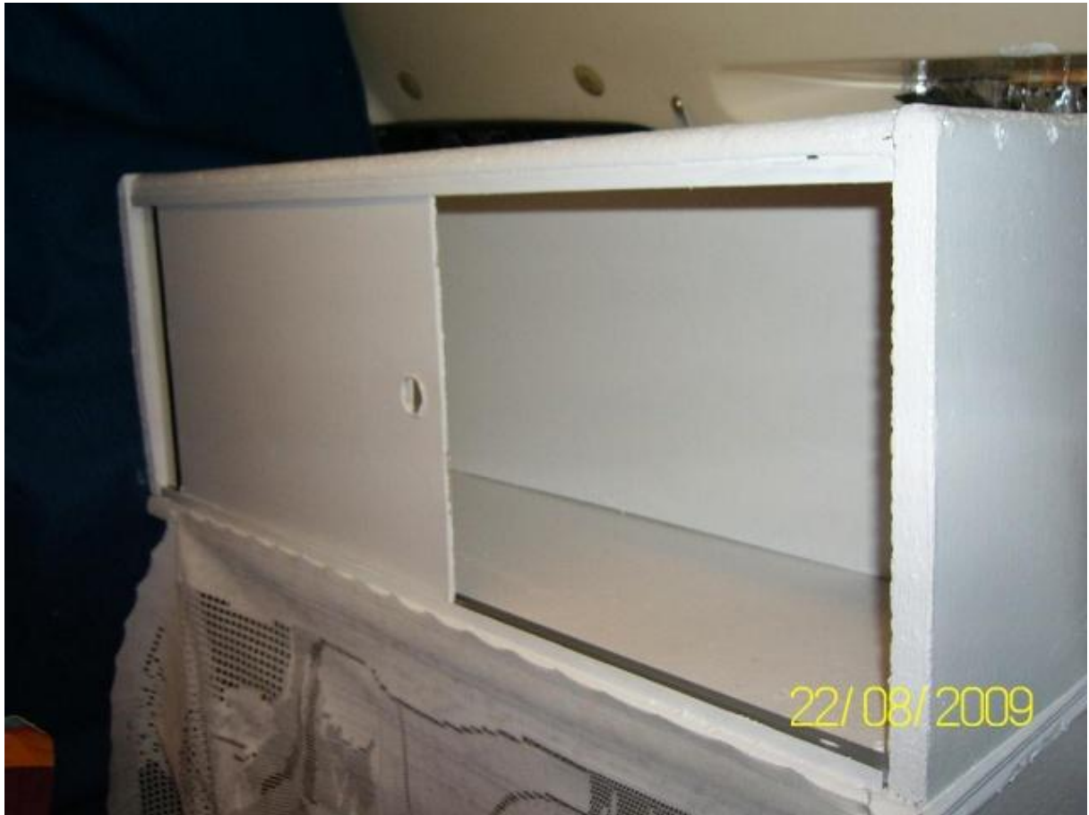
l'autre porte ...