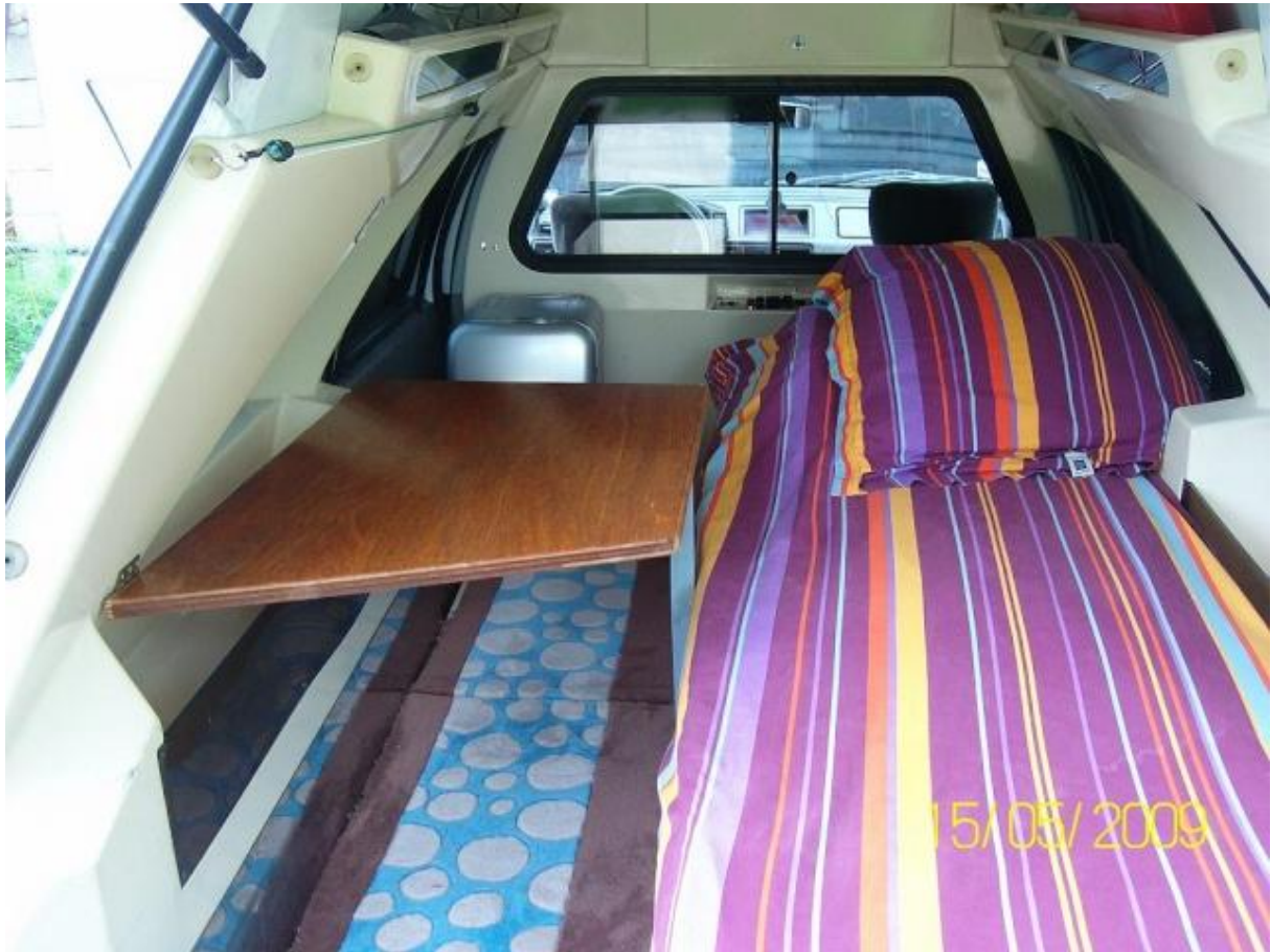
montage du cadre sur charnières ...vu que j'ai modifié l'orientation du lit ...(tête vers la séparation)