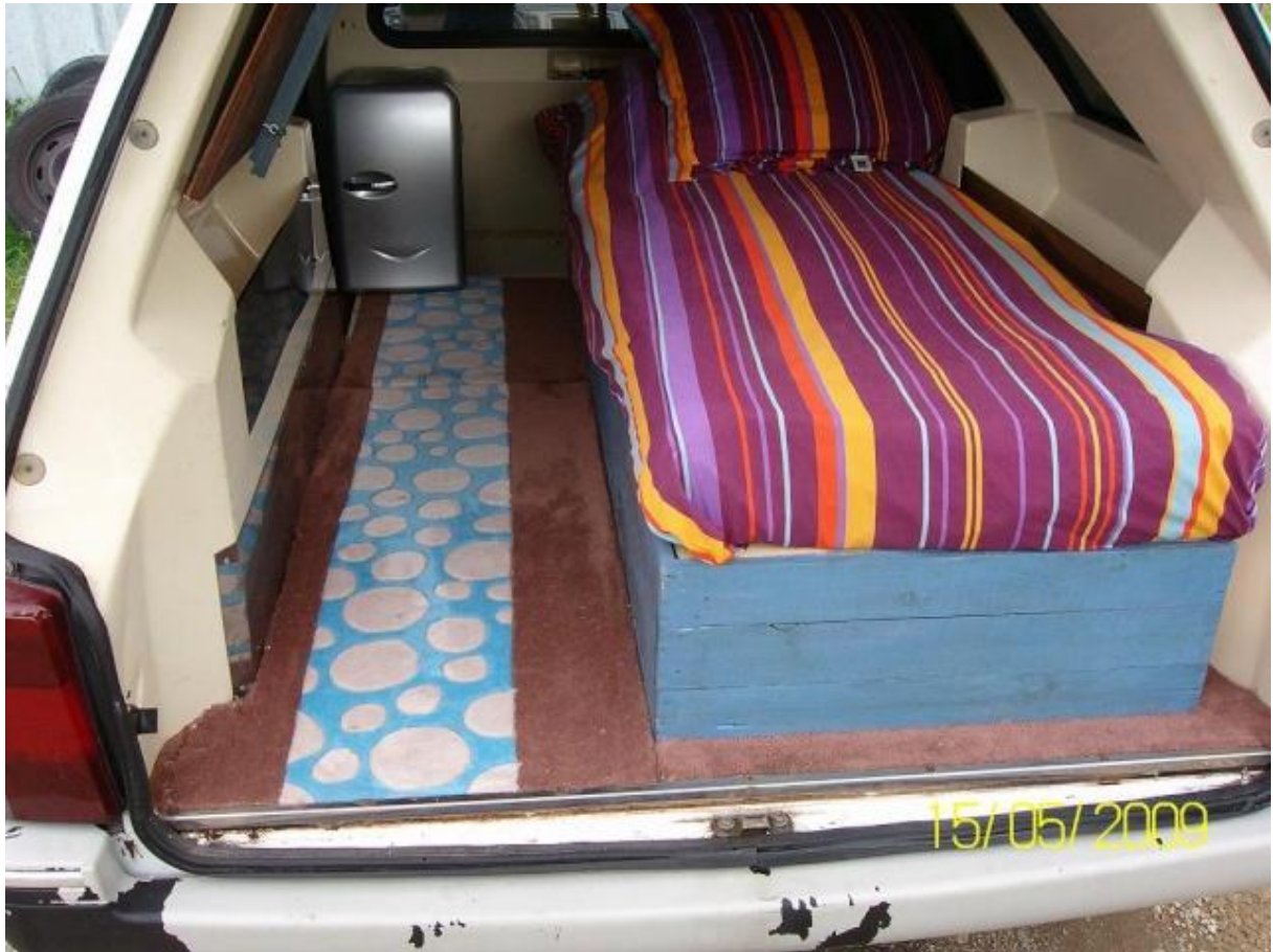
aperçu avec la table rabattue