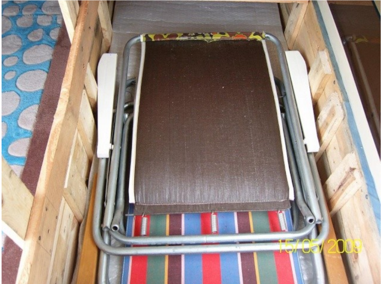
enlevé la cloison de séparation..