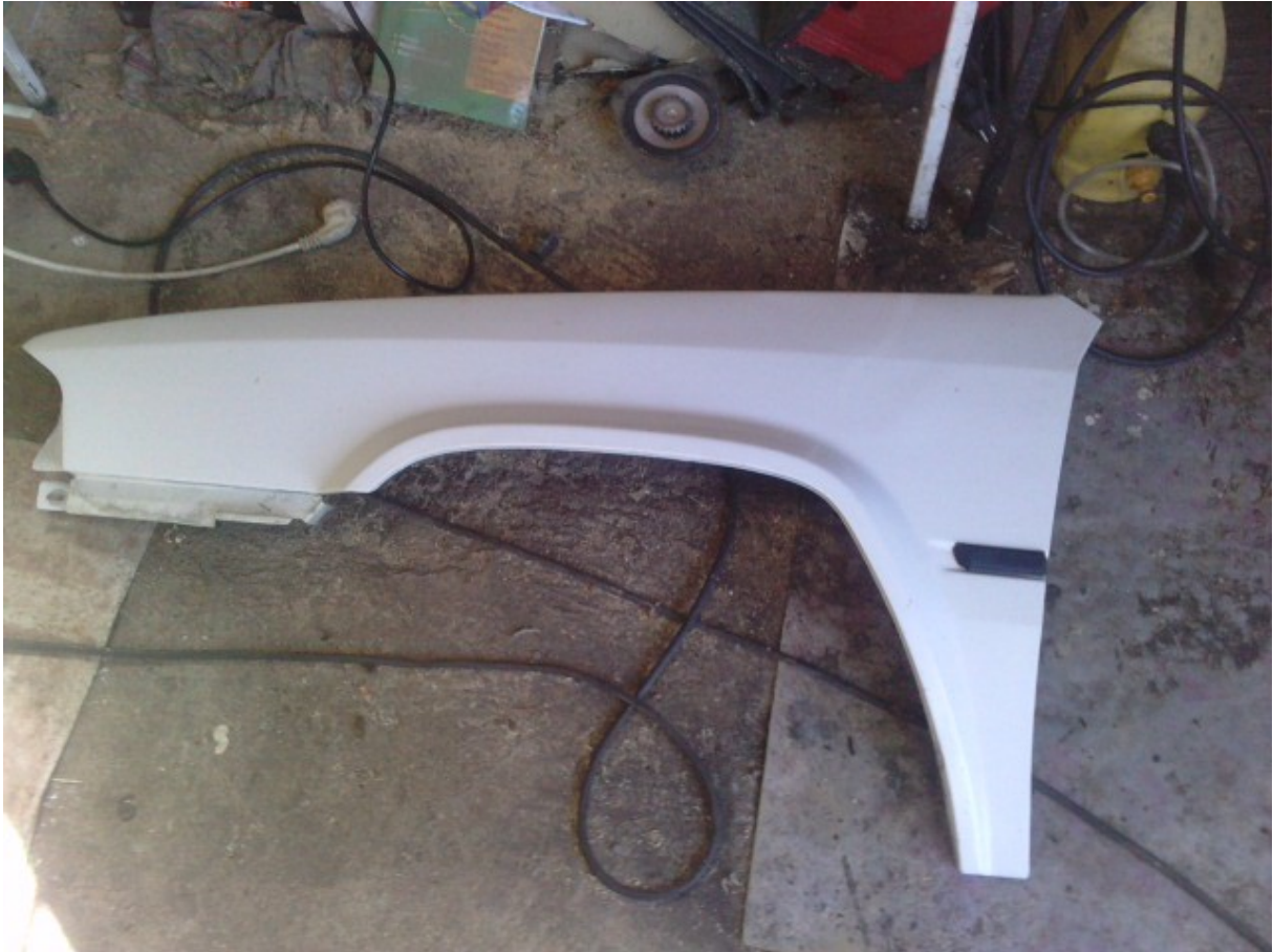
la nouvelle montée ...on voit bien que la teinte n'est pas tout a fait la même..