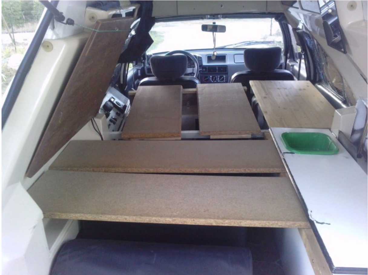
des supports pour les planches arrières rivetés ..