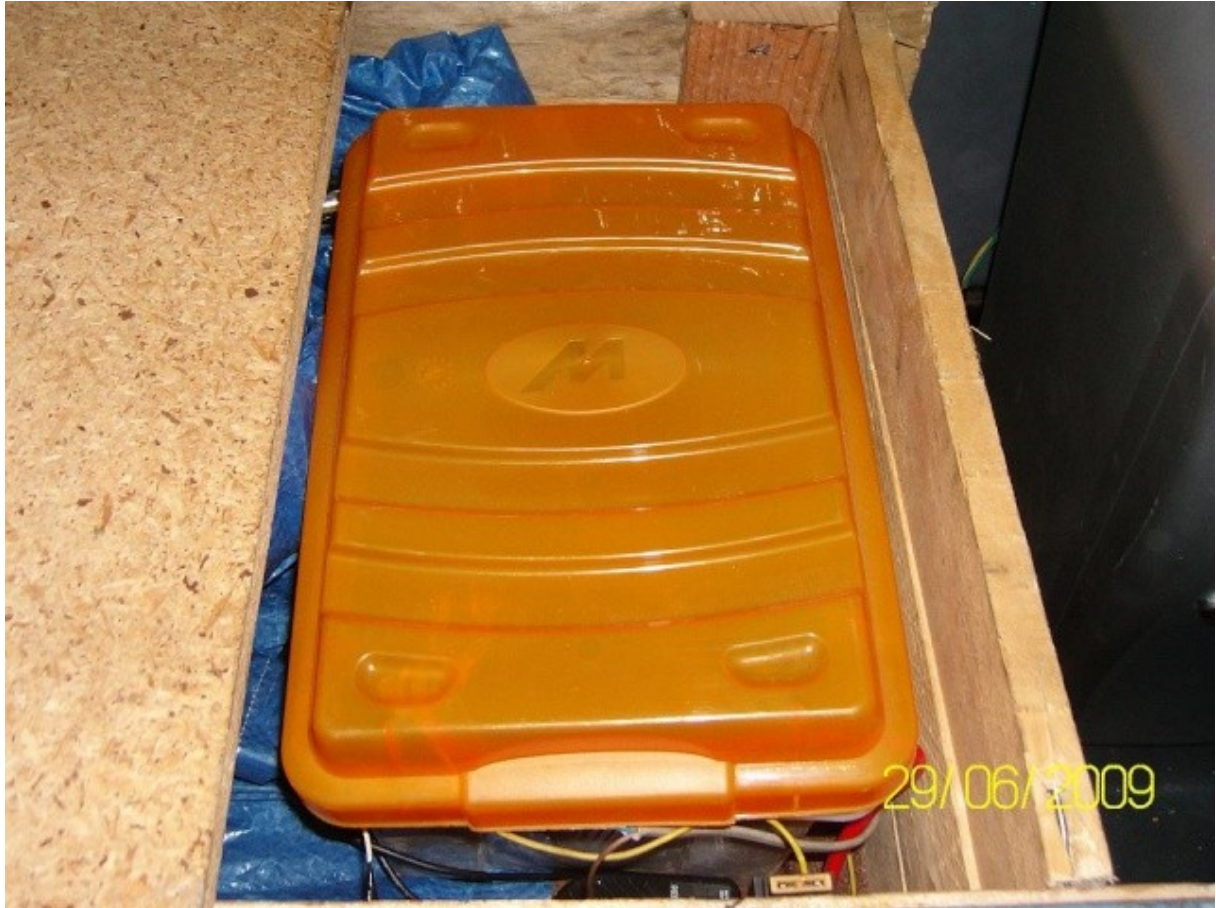
la dernière lame du plancher me sert de support extérieur