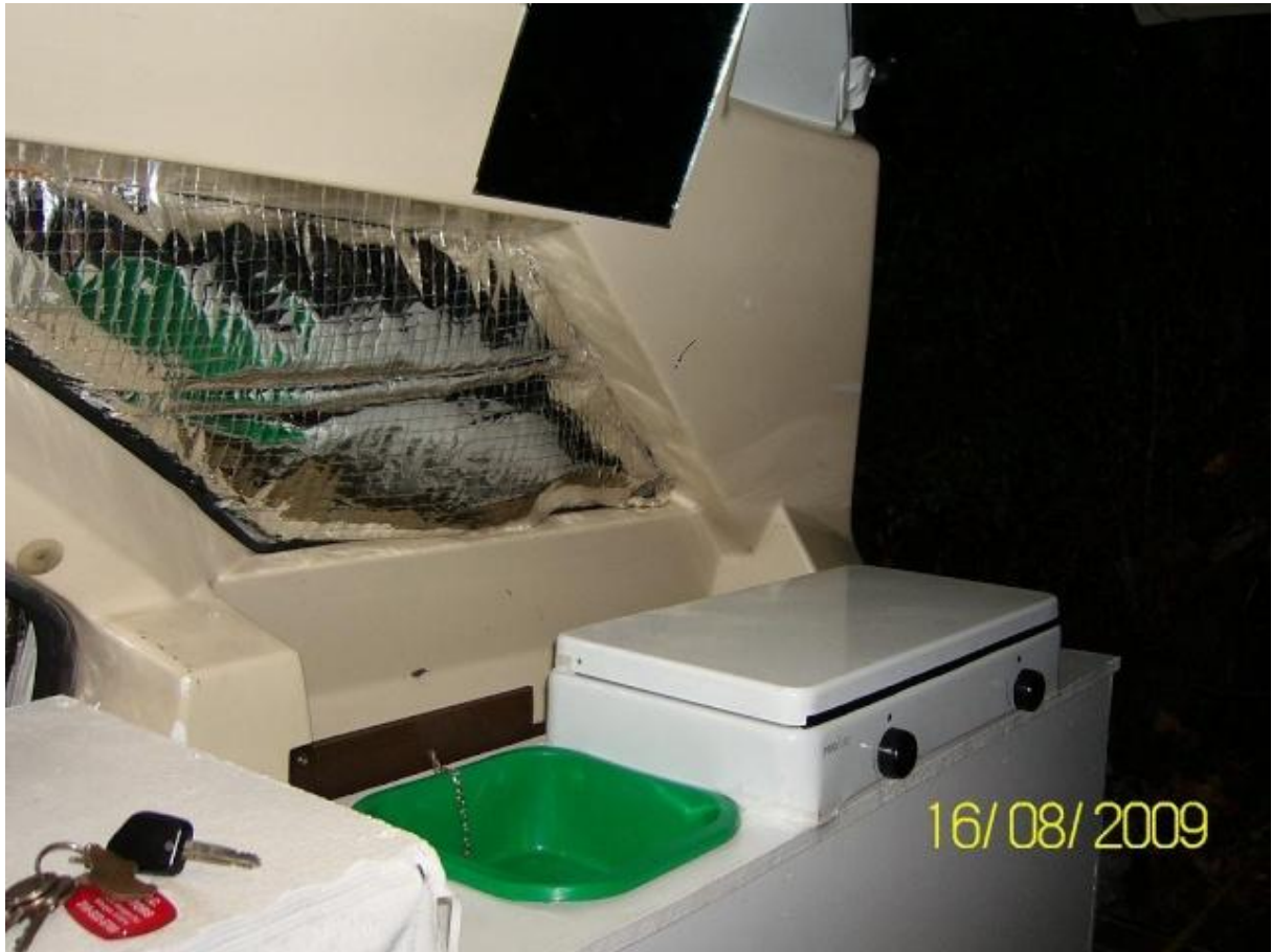
la suite de l'aménagement le meuble est terminé