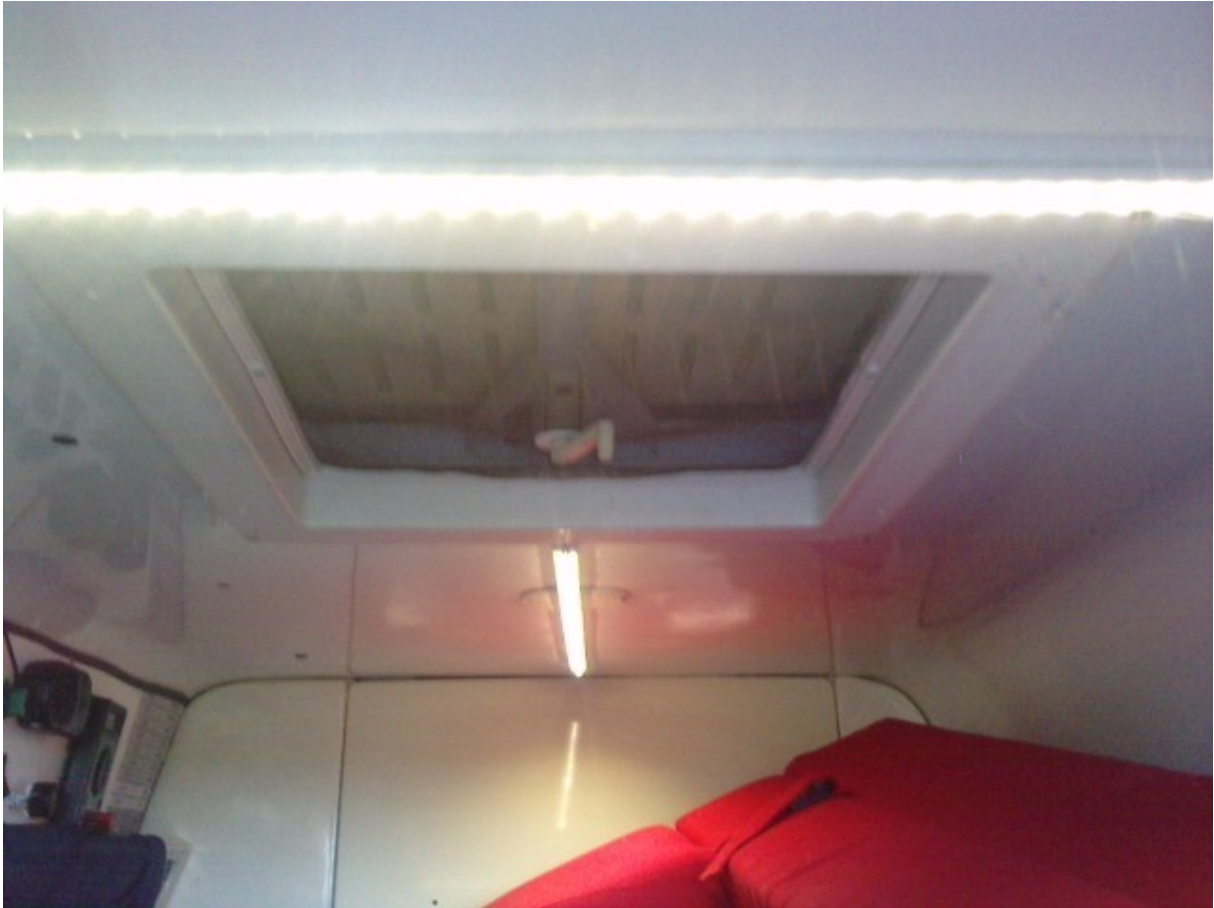
Et j'assemblerais tout ça a la demande ..