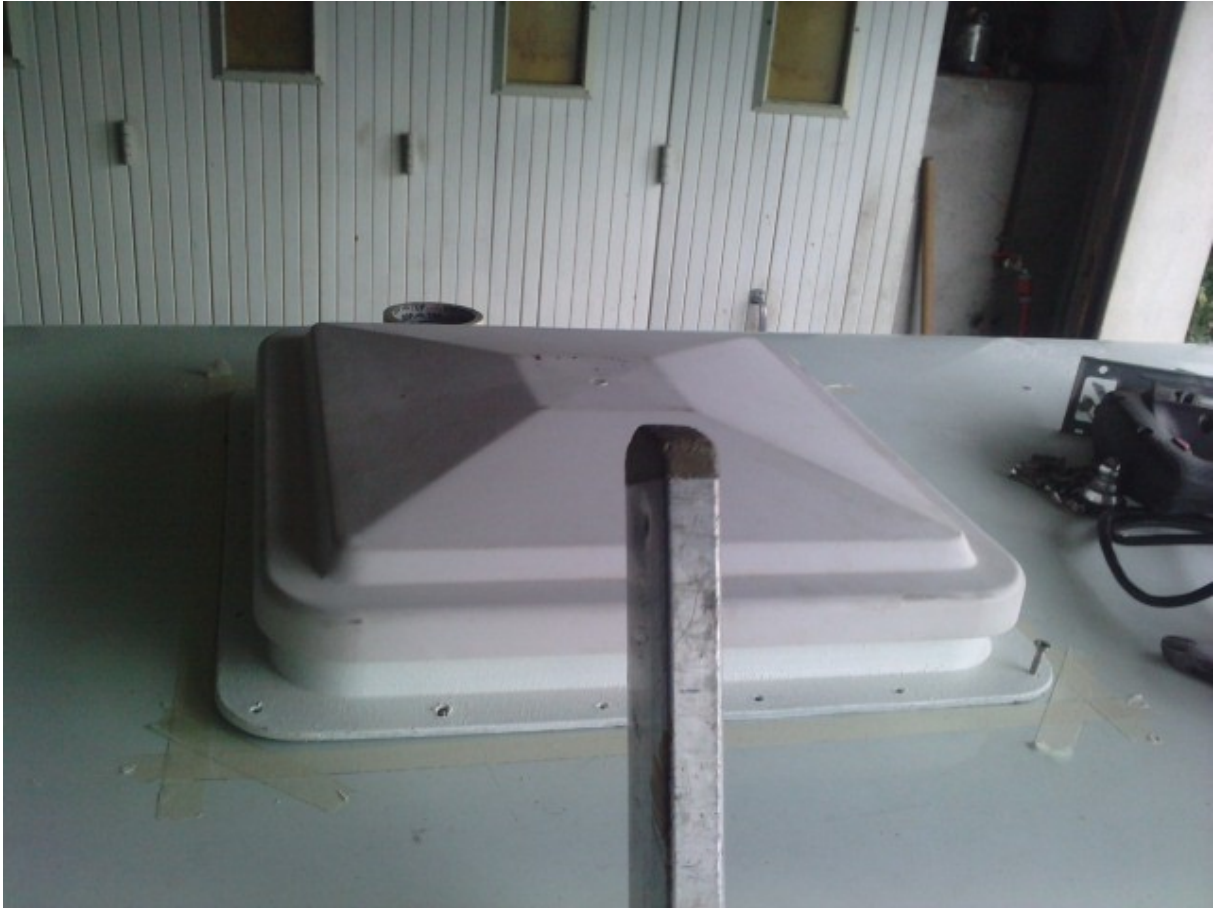
pose des vis