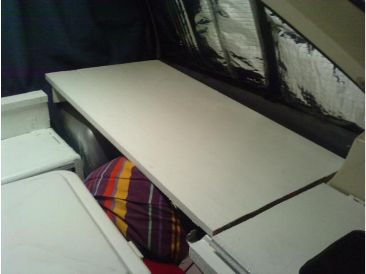
et le support de lit ..