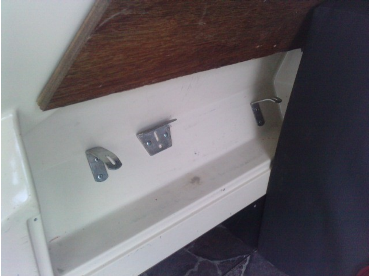
là on voit le support coté droit ..