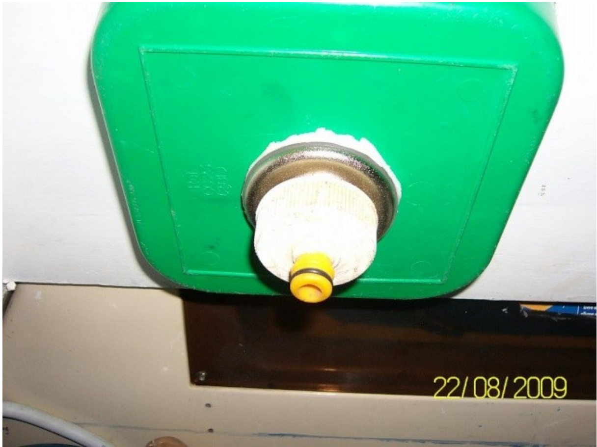
le meuble ouvert..