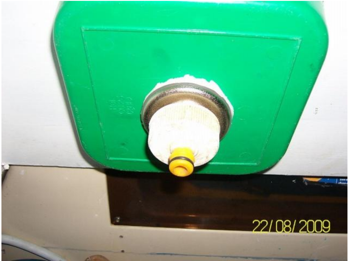
le meuble ouvert..