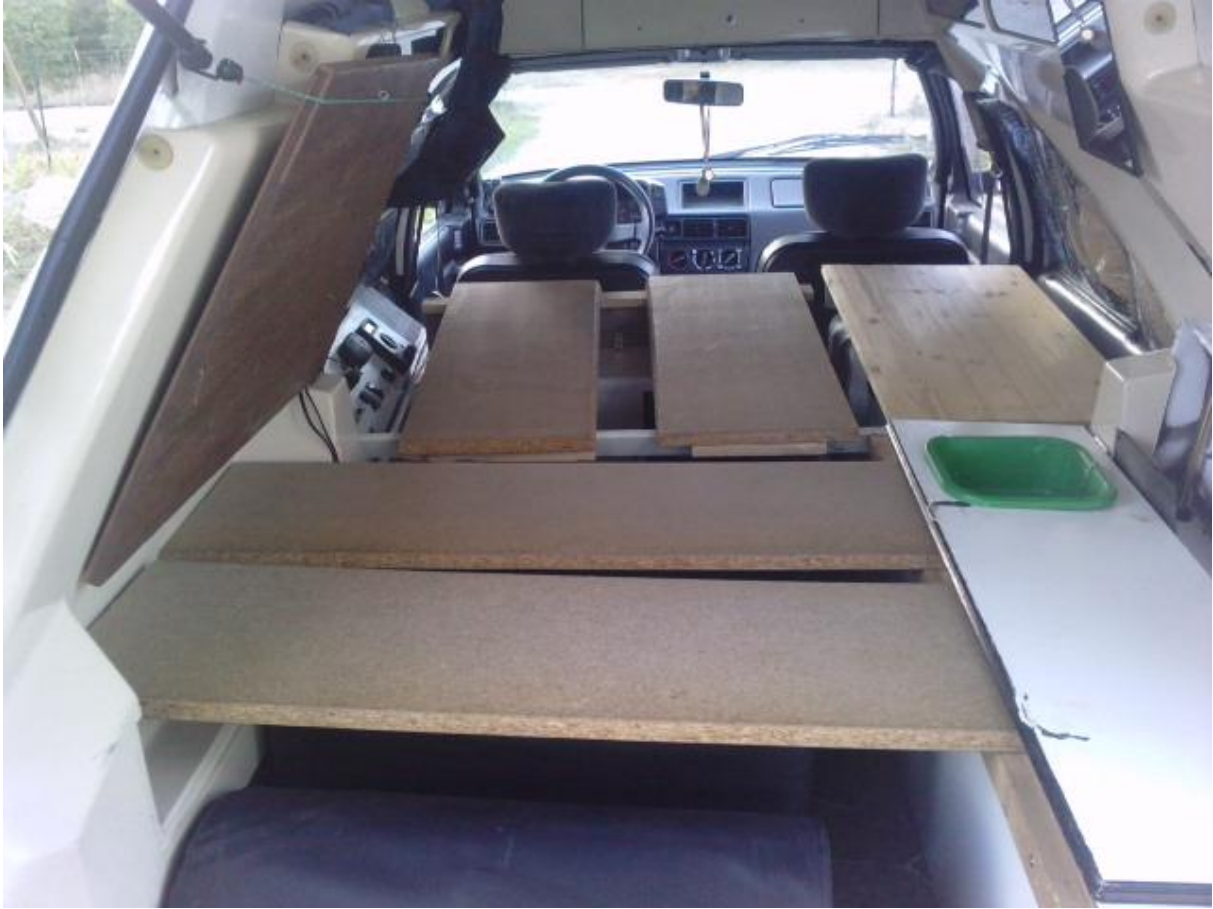
des supports pour les planches arrières rivetés ..