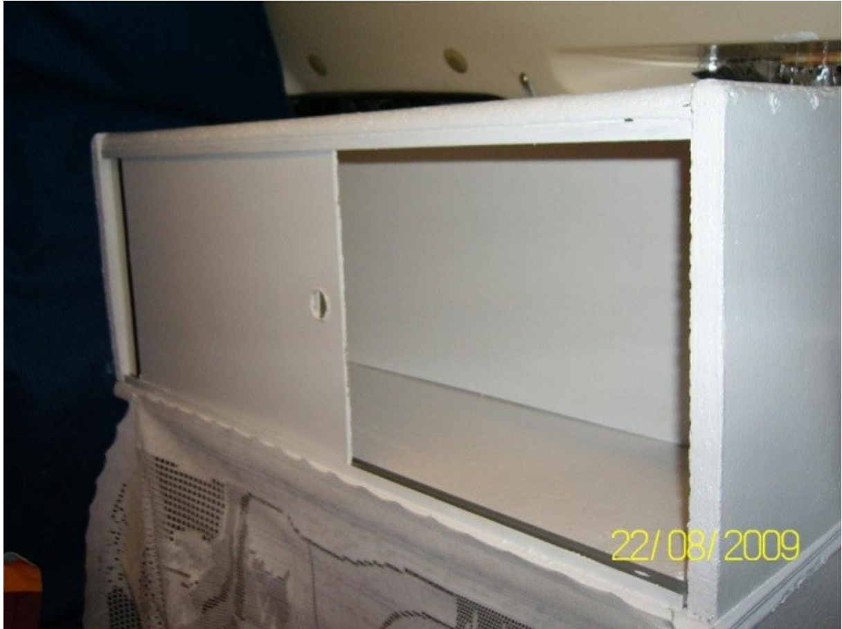
l'autre porte ...