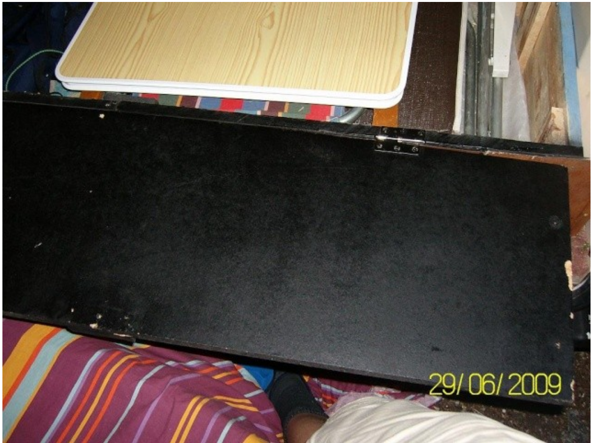
un sac de couchage et j'ai monté des hp de chaine hifi