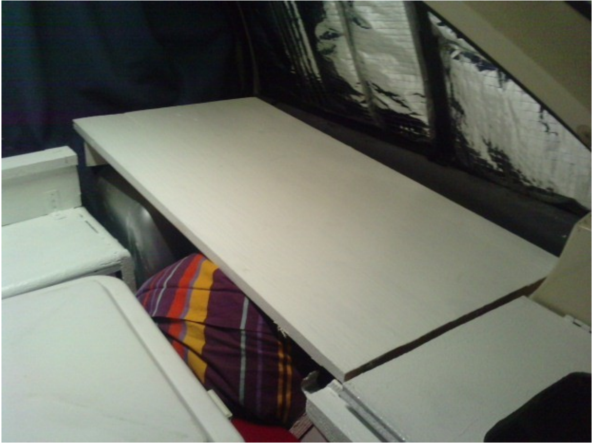
et le support de lit ..