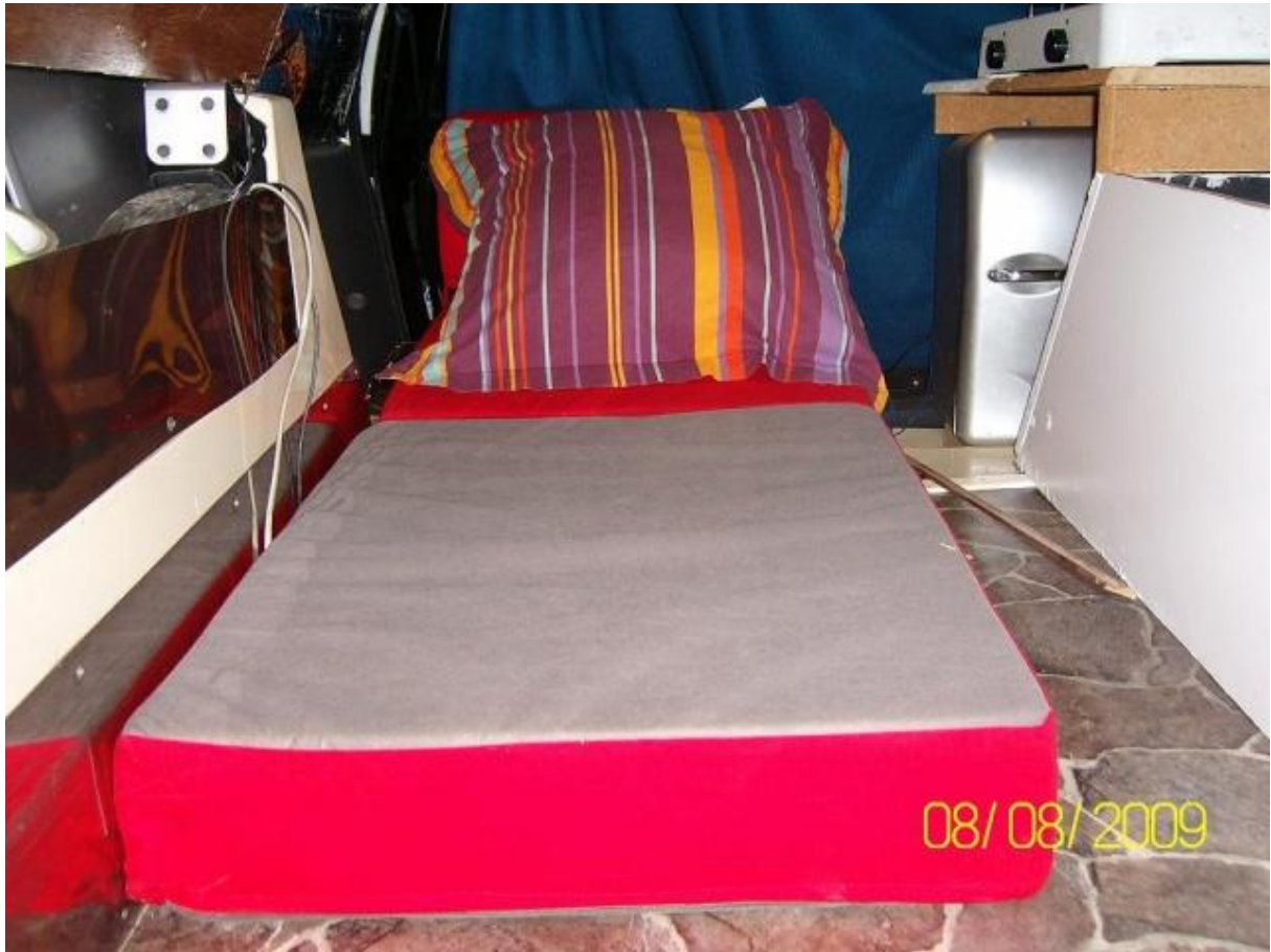
entre le frigo et la portière le jerrycan eaux propres..