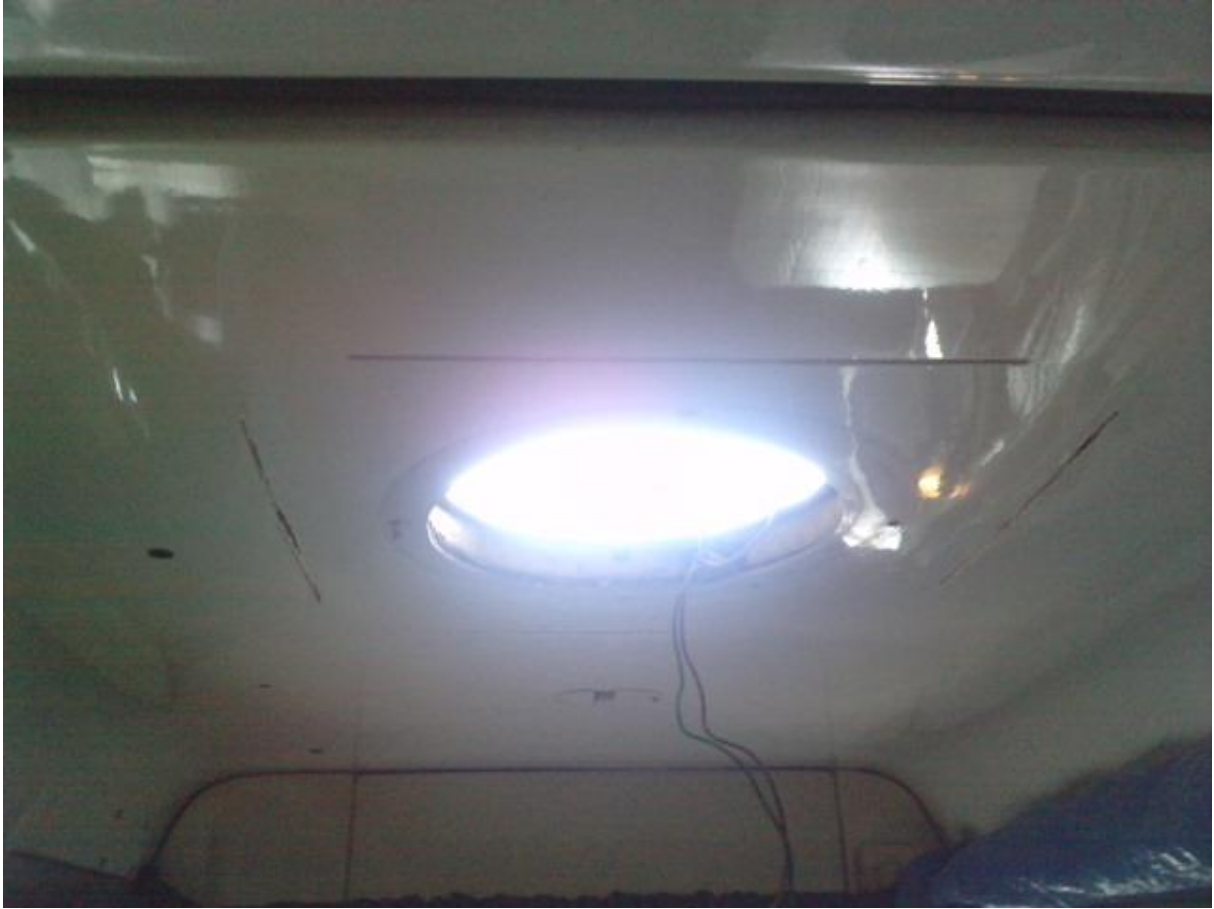
pose a blanc pour voir si c'est ok!