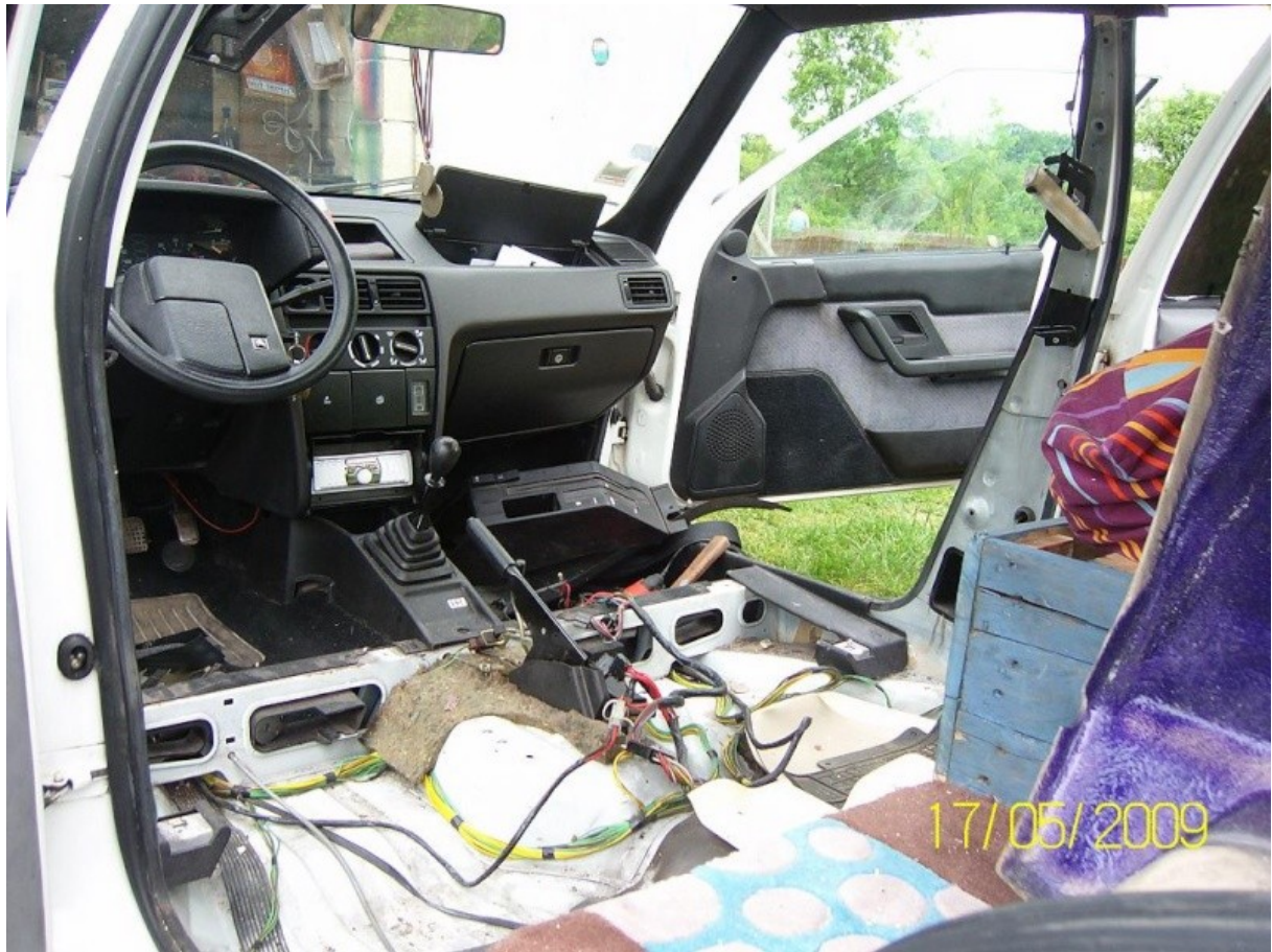
Ensuite j'ai mis un rideau.. Vu de l'extérieur ..