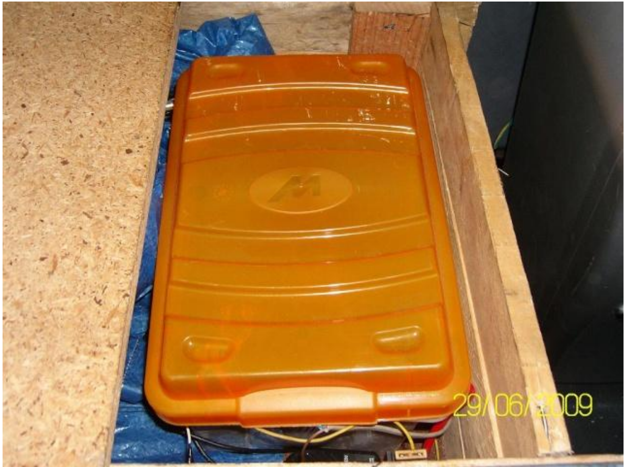
la dernière lame du plancher me sert de support extérieur