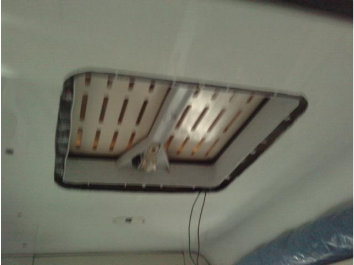
pose des tasseaux de bois ..