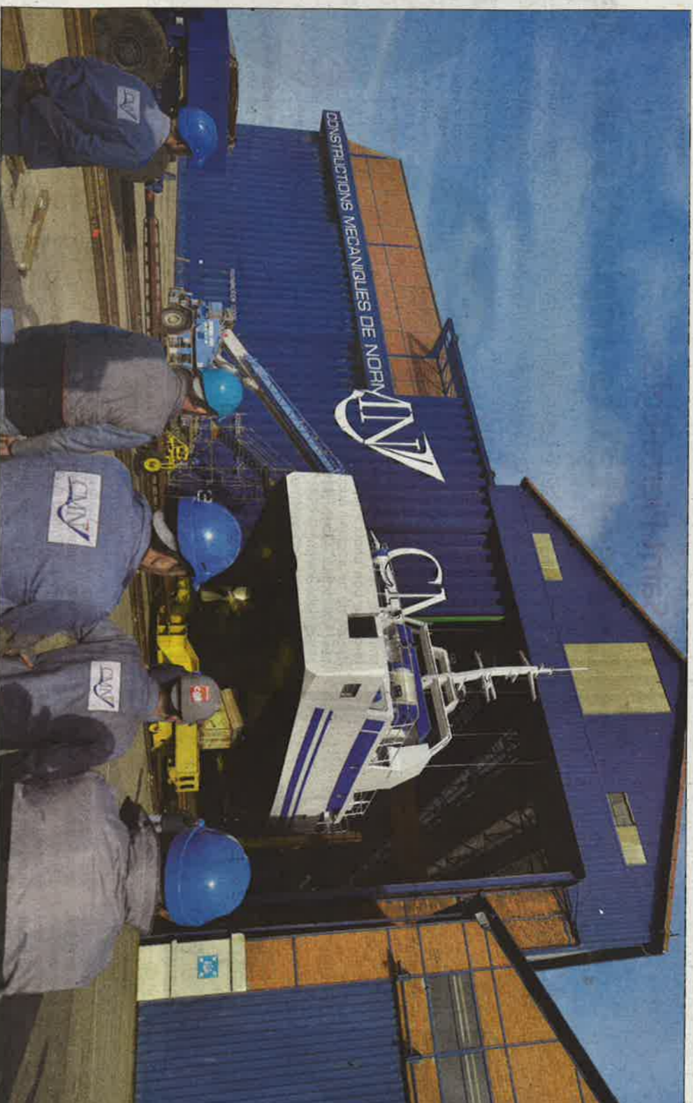
De nombreux salariés sont venus assister à la sortie des deux premiers palangriers destinés au Mozambique

Dans les nefs du chantier, il y avait avant, cette sortie une enfilade de cinq palangriers. « Il n'y a guère qu'une semaine de décalage pour le troisième, le quatrième est en peinture et le cinquième suivra aussitôt après », in-